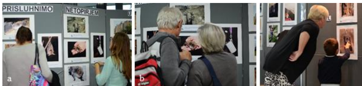
Slika 2: a) Razstavo smo poimenovali »Prislunhimo netopirjem« in jo razdelili na več tematskih sklopov. b, c) S postavitvojo ter izbranimi fotografijami smo dosegli, da je bila primerna prav za vsakogar.

Vsebinsko smo razstavo razdelili na več sklopov. V uvodnem sklopu smo izpostavili osnovne morfološke značilnosti netopirjev in njihovo ekologijo. V sklopu » Urbano okolje « smo poudarili prisotnost netopirjev v mestih. S fotografijami mestnega parka Tivoli, reke Ljubljanice in stolpnic smo prebivalcem Ljubljane še dodatno približali zavedanje, da so netopirji naši sosede. S sklopom » Ogroženost in varstvo « smo opozorili na zaščitenost netopirjev in poudarili, da mnenje in aktivnosti vsakega posameznika štejejo in pripomorejo k uspešnemu varovanju teh ogroženih sesalcev. V zadnjem sklopu » Letni cikel « pa smo predstavili kako netopirji v evropskem prostoru preživijo leto.