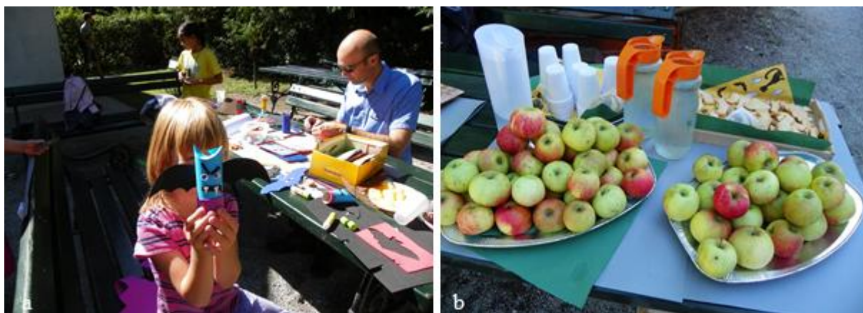
Slika 8: a) Izdelani netopirji so bili pisanih barv, saj smo s predhodnimi pogovori ugotovili, da je netopirjev kožušček vse prej kot črne barve. b) Malica je prav prišla, saj so se mnogi udeleženci delavnice, kasneje udeležili še predavanja in vožnje z ladjico po Ljubljani.

Udeležencem smo postregli z ekološko pridelanimi jabolki v občini Ljubljana. S čimer smo podprli lokalno pridelavo.