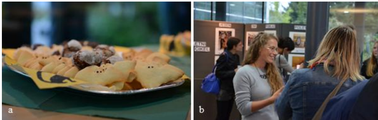
Slika 3: a) Pogostitev s piškoti v obliki netopirskih silhuet je obiskovalce navdušila in b) hkrati pripomogla k bolj spročenemu vzdušju. Tako smo že pred predavanjem, ob razstavi, razvili zanimive pogovore.

Ob otvoritvi razstave smo poudarili namen dogodka, prisotnim predstavili program ter jih povabili k sodelovanju. Hkrati smo pripravili tudi pogostitev, ki je vključevala piškote v obliki silhuet netopirjev. Piškote so spekli v pekarni Slapek, ki je pod okriljem Biotehniškega izobraževalnega centra, s čimer smo podprli lokalno dejavnost.