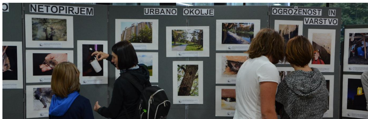
Slika 1: Nazorne fotografije netopirjev, njihovih zatočišč in prehranjevalnih habitatov so pritegnile pozornost prav vsakega obiskovalca.

Razstavili smo 31 fotografij, ki so nazorno predstavile morfologijo netopirjev, njihova zatočišča, prehranjevalne habitate, letni cikel in se dotaknile tudi njihovega varstva ter ogroženosti. K vsaki fotografiji smo dodali zanimivo in poučno besedilo.