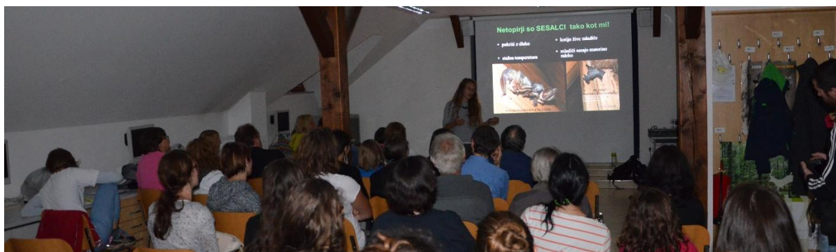
Slika 4: V sklopu projekta smo izvedli dve predavanji: 5.9. in 6.9.2015. Udeleženci so predavanje popestrili s svojimi netopirskimi prigodami, kar je doprineslo k sproščenosti in k uspešnejši izvedbi predavanja.

Z vsebino predavanja smo udeležencem predstavili netopirje kot nenevarne sosede. Podali smo njihovo osnovno biologijo, poudarili njihovo vlogo v naravi, se dotaknili varstva in njihove ogroženosti ter razbili tabuje, ki krožijo o teh edinih letečih sesalcih na svetu.