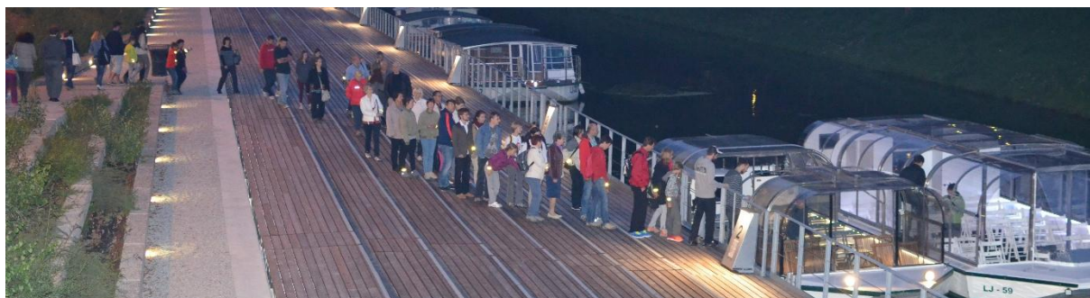
Slika 5: Po predavanju smo se odpravili na Gruberjevo nabrežje, prestopili na ladjici in se zapeljali proti centru mesta.

Pri predstavitvi netopirjev smo se predvsem osredotočili na vrste netopirjev, ki prebivajo v Ljubljani. Navedli smo tudi nekaj lokacij v mestu, kjer jih lahko ob mraku meščani opazujejo, kako se podijo za žuželkami. Prav tako pa smo med predavanjem, kot tudi po izvedbi, z veseljem odgovorili na vsa zastavljena vprašanja.