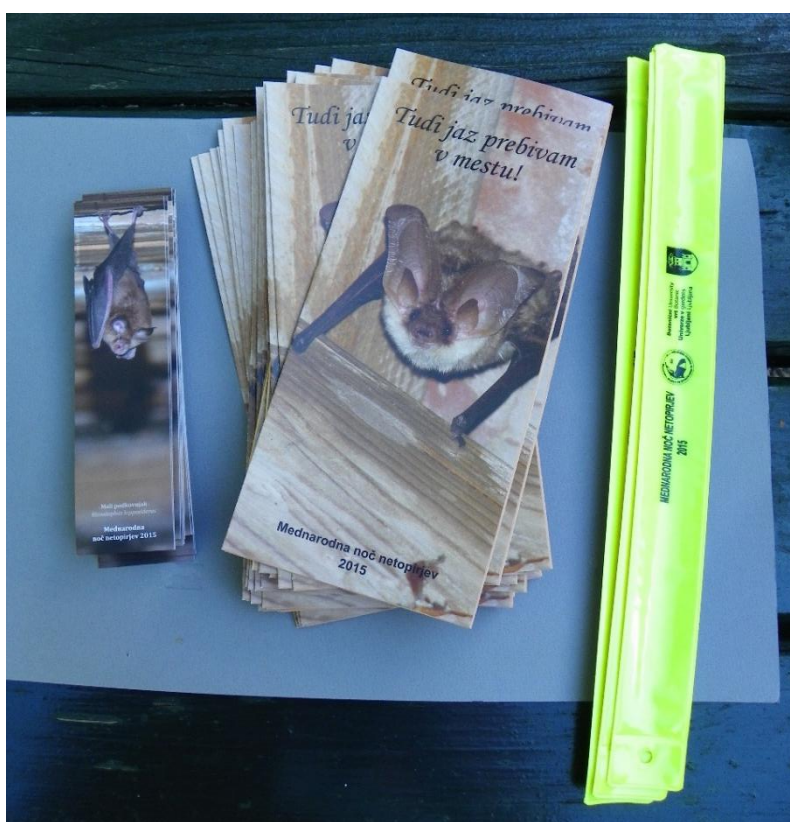
Slika 9: Raznolik promocijski material, ki smo ga pripravili ob dogodku »Prisluhnimu netopirjem Ljubljane« s finančno pomočjo Mestne občine Ljubljana - za vsakogar nekaj.

Pripravili pa smo tudi praktični promocijski material v obliki odsevnih trakov. Opreмили smo jih z napisom »Mednarodna noč netopirjev 2015«, dodali logotip Mestne občine Ljubljana, logotip društva SDPVN in logotip partnerja projekta, to je Botanični vrt Univerze v Ljubljani.